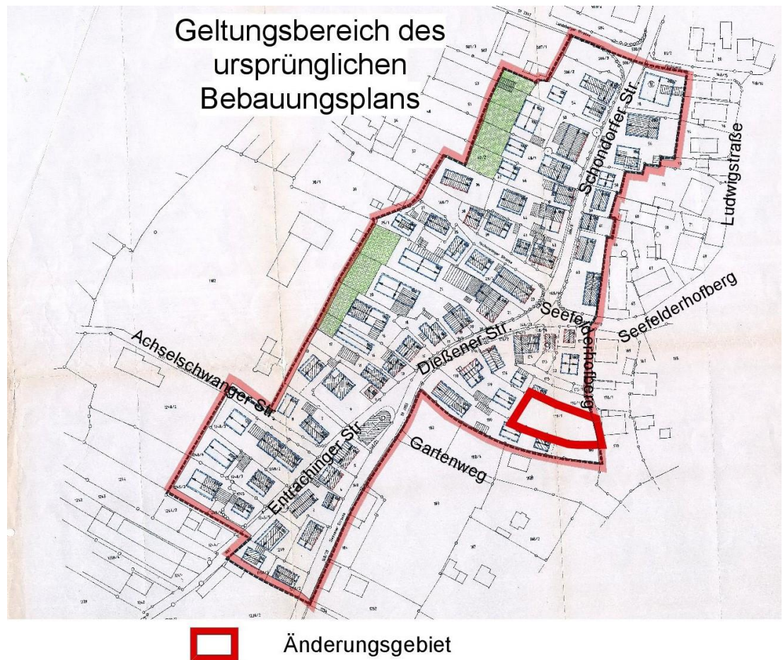
Abb. 1 Lage des Änderungsgebietes im ursprünglichen Bebauungsplan