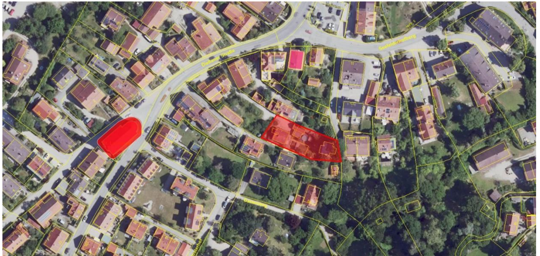
Abb. 2 Bau- und Bodendenkmäler, ohne Maßstab, Quelle: Bayerische Vermessungsverwaltung, Bayerischer Denkmal-Atlas, Stand 26.04.24

Archäologische Fundstellen werden im Geltungsbereich und im näheren Umfeld nicht vermutet. (Auf die ungeachtet dessen nach Art. 8 DSchG bestehende Meldepflicht an das Landesamt für Denkmalpflege oder die Untere Denkmalschutzbehörde beim Landratsamt bei evt. zu Tage tretenden Bodenfunden wird hingewiesen.)