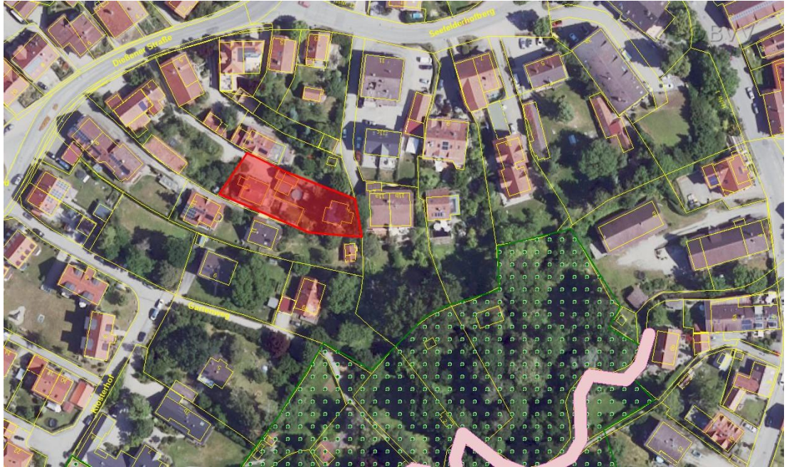
Abb. 4 Naturschutzgebiete und Biotope, ohne Maßstab, Quelle: Bayerische Vermessungsverwaltung, Stand 04.2024

Das Landschaftsschutzgebiet "Ammersee-West" (LSG-00509.01) befindet sich weniger als 50 Meter vom Grundstück entfernt, und das Gewässer-Begleitgehölz "Uttinger Mühlbach" (7932-0264) liegt in der Nähe des Planungsgebietes. Diese werden jedoch durch die beabsichtigte Änderung voraussichtlich nicht beeinträchtigt.